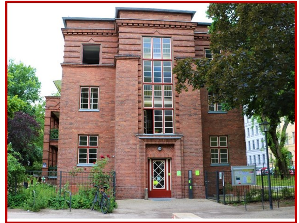
Adalbertstraße 23 A