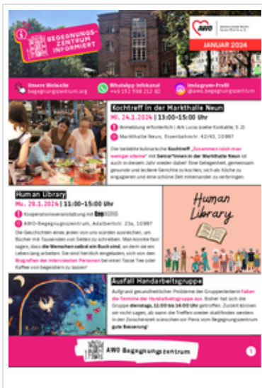
Januar 2024 als Pdf.