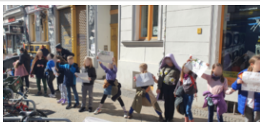
Kinder nehmen an der Aktion in der Adalberstr. (Menschenkette) im Zeichen des Internationalen Tag gegen Rassismus teil.

Spring über's Feuer! Feiern von Newroz und arabischen Mutter*tag an der Feuerschale im Garten des Begegnungszentrum