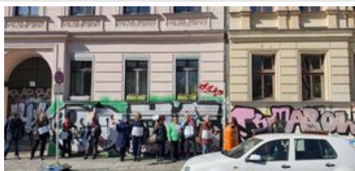
Aktion in der Adalberstr. (Menschenkette) Im Zeichen des Internationalen Tag gegen Rassismus.