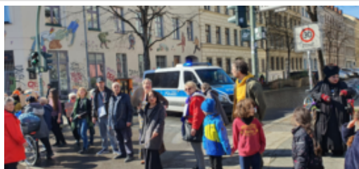
Aktion in der Adalberstr. (Menschenkette) Im Zeichen des Internationalen Tag gegen Rassismus.

#itgr2024 #awogegenrassismus #buntstattbraun #vielfalt #demokratie #menschenrechtefüralle #HandinHand, #WirsinddieBrandmauer, #UtopieMenschenrechte #internationalertagegegenrassismus #partizipationsbeiräteberlin