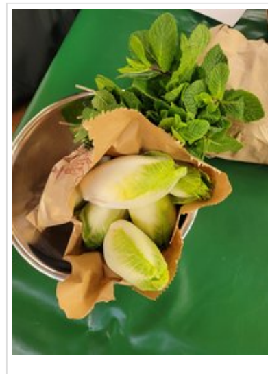
Lebensmittel für die Rezepte